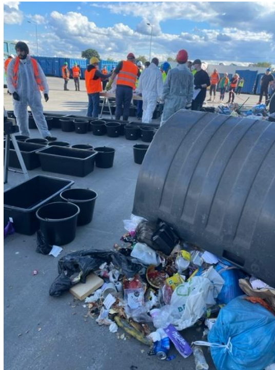
Ilustrační foto č. 4 – provádění rozboru smíšeného komunálního odpadu Zdroj - MPG

Objemný odpad odevzdávají občané na sběrném dvoře, nebo pověřené odborné firmě do přistavených velkoobjemových kontejnerů, a také při mobilním sběru přímo do svozového vozidla podle instrukcí obsluhy. Při přebírání objemného odpadu zajišťuje přebírající obsluha oddělení recyklovatelných složek (minimálně kovů, plastů a dřeva velkých rozměrů). Odborná firma následně zajišťuje další úpravu objemného odpadu s cílem získat z něj využitelné složky, jako například dřevo, plast, kovy, sklo za účelem jejich recyklace, či jej využívá jako složku pro alternativní palivo, nevyužitelný zbytek je obvykle uložen na skládce nebo využit pro výrobu tuhého alternativního paliva, případně je spálen ve spalovně komunálních odpadů.