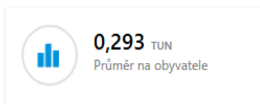
Graf č. 1 – produkce v měsíci osa Y: množství v tunách osa X: měsíc